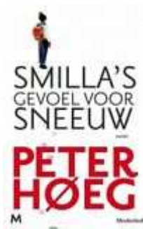
Peter Høeg - Smilla's gevoel voor sneeuw

Eén man, een four-wheel drive en tienduizend kilometer uitgestrekte leegte. Dat zijn de eenvoudige basisingrediënten van 'Hot – life in the Australian outback', het nieuwe fotoboek van de Nederlandse reisfotograaf Thijs Heslenfeld. 'Hot' is de opvolger van het succesvolle 'Cold – sailing to Antarctica', één van de best verkochte Nederlandse fotoboeken van 2008. Op de speciale website www.hot-the-book.com krijg je alvast een voorproefje van de prachtige beelden in dit boek.